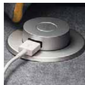
Porta USB USB holder Port USB