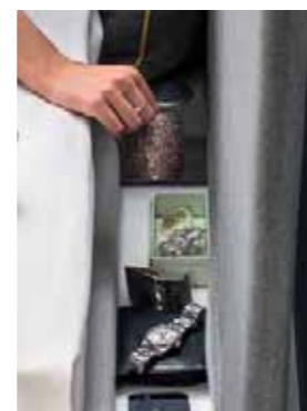
Portagioie Jewelry Box Porte-bijoux

L'élégance de la simplicité. Le cordon de couleur contrastée sur les bords des grands coussins de la tête de lit et sur les angles de jonction au pied du tour de lit.