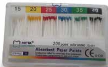
Хартиени щифтове 015 - 040 - MetaBiomed - Корея