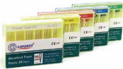
Хартиен щифт 04 Gapadent Taper