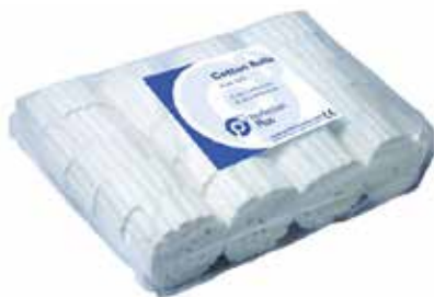
Памучни ролки нестерилни