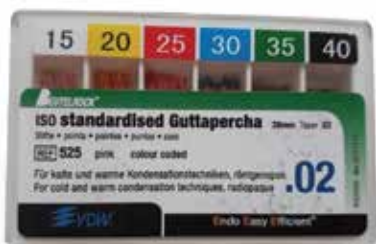
Гутаперка щифтове 015 - 040 - VDW - Германия