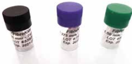
Фибро щифтове Fiber post - 10 бр. Pentron