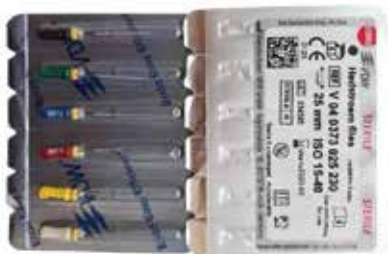
К-разширители Хедшрьом 25 мм / 015-040 VDW - Германия