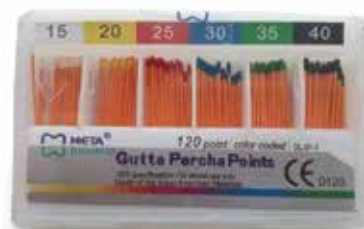
Гутаперка щифтове 15-40 MetaBiomed - Корея