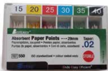
Хартиени щифтове 015 - 040 - VDW - Германия