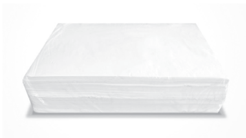
Хигиенна вата - бежова