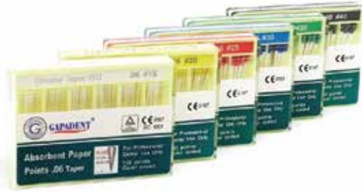
Хартиен щифт 06 Gapadent Taper