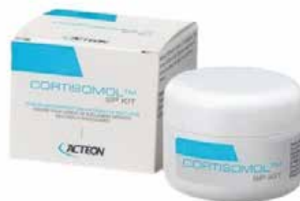
Каналопълнежно Cortisomol SP