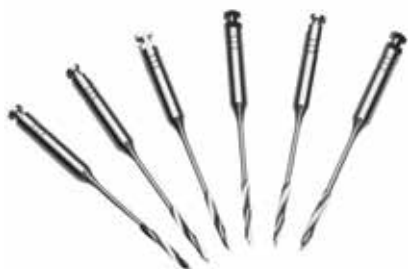
Машинни разширители Pesso VDW - Германия