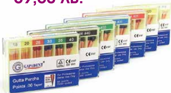
Гутаперка щифт 06 Gapadent Taper