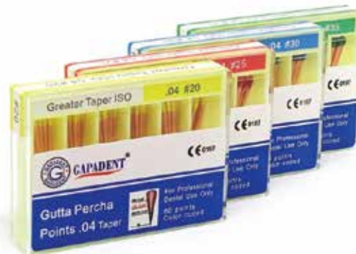
Гутаперка щифт 04 Gapadent Taper