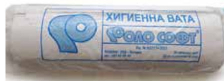
Хигиенна вата Роло софт - 0.5 бежова