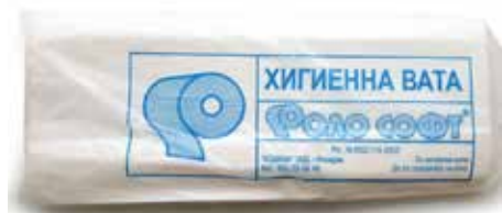
Хигиенна вата Роло софт 0.3 бяла