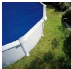
Изотермично покривало Isothermic cover CPROV1020