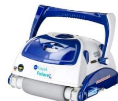
Робот Robot RKFA100