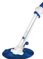
Автоматична подочистачка Automatic cleans 19001